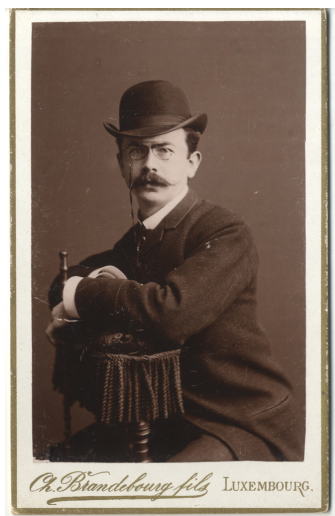
FIG. 1: Batty Weber.

décrite par le verbe « tuten » : les musiciens jouant d'un instrument à vent. 4