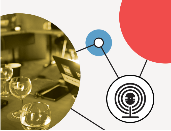
ABBILDUNG 1: Collage (CC0). Five Questions – One Answer?

In diesem Audio-Essay stehen Perspektiven von Digital Humanists auf die Digital Humanities zentral. Die Collage von dreizehn eigenständigen kurzen Audiobeiträgen bietet ein Panorama der Digital Humanities. Da die Digital Humanities so vielfältig sind wie ihre Protagonisten, kann eine Repräsentativität nicht das Ziel sein. Die Beiträge dieser Episode laden daher vor allem dazu ein, über die Digital Humanities nachzudenken und die Digital Humanities weiter zu denken.